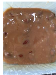
〈型に流しこんだら冷蔵庫へ〉