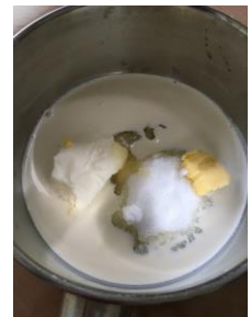
〈小鍋に材料を全部入れます〉