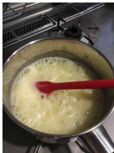
〈弱火でコトコト、こげないように気をつけましょう〉