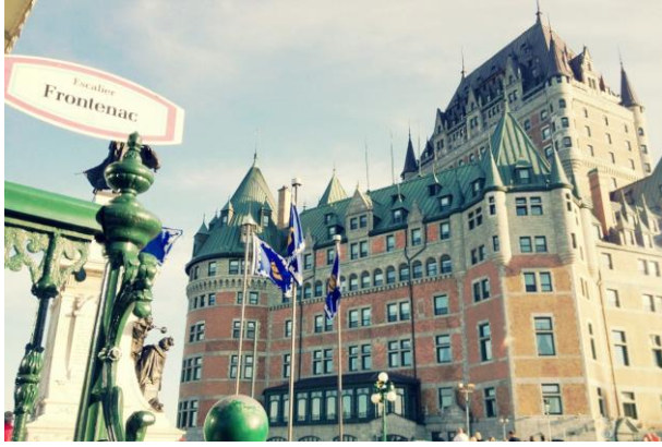
(ケベックの街並み)