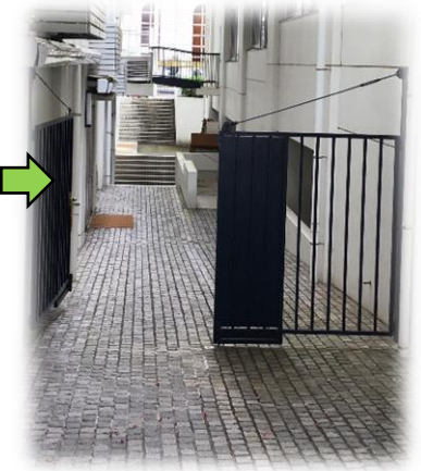
中庭奥、右手の通路