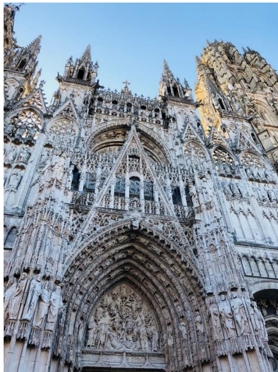
2018 年 7 月